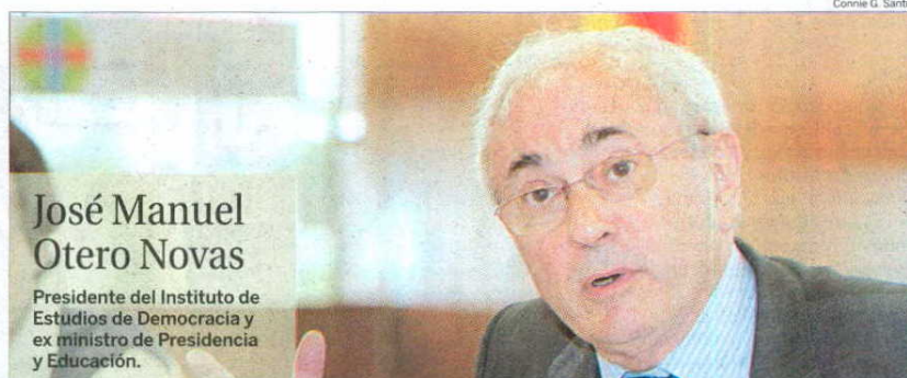
José Manuel Otero Novas

Presidente del Instituto de Estudios de Democracia y ex ministro de Presidencia y Educación.